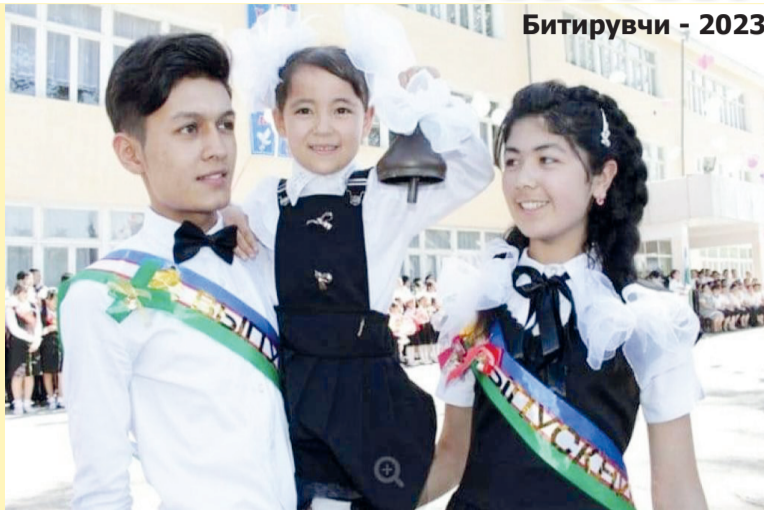
Битирувчи - 2023

Болалар олами учун ва истаган ёшдагилар учун ҳам ғоятда зарур бўлган битта ахлоқий сабоқ борки, у ҳам бўлса ҳеч кимга ёмонлик қилмасликдир.