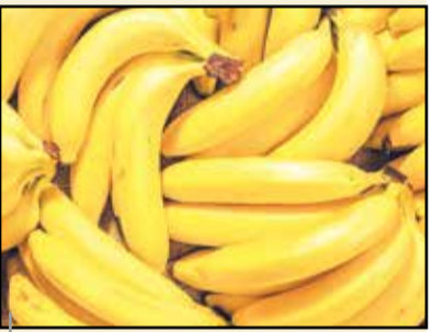
бўлишлари керак. “Ҳидоят” журналидан.

асаб тизимини тинчлантиради, қондаги шакар моддасини кўтаради. Бош оғриғи (мигрен)ни пасайтириш учун пишган банан пўстлоғи пешонага ёки бошнинг орқа томонига қўйилади. Пўстлоқнинг ички тарафи куйган терига, тошмага, йирингли ярага қўйилса, фойда беради. Эслатма. Банан қонни қуюқлаштиради, шунинг учун инфаркт ва инсулт бўлган кишилар уни ейишда эҳтиёт