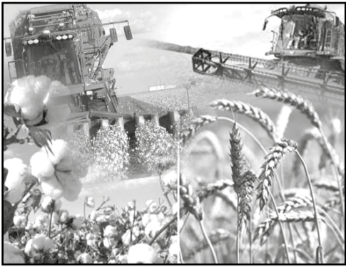
Давоми. Бошланиши 1-бетда.

Соҳада ҳисоб-китоб интизомида ҳам камчилик борлиги айтилди. Масалан, кластерларнинг фермерлар олдидаги қарздорлиги ҳали тўлиқ тўланмаган.