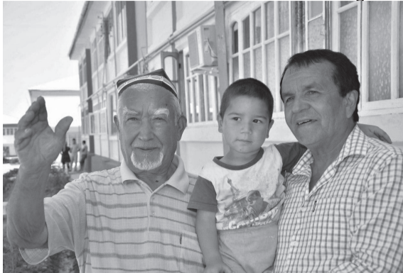
Давоми. Боши 1-бетда.